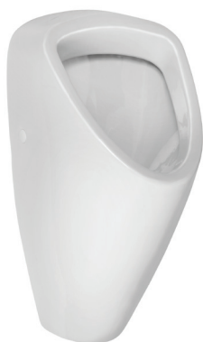
SLP 49 - CAPRINO PLUS