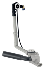
Obrázek s příkladem