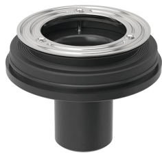
Obrázek s příkladem