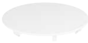
Ablaufdeckel KA 90