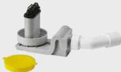
Model KA 4121