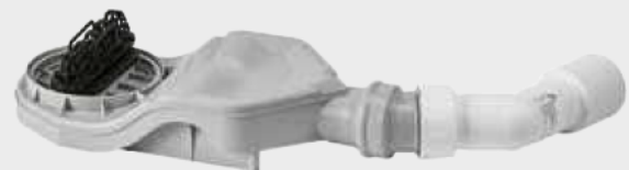
Model KA 4122