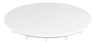
Ablaufdeckel KA 120 für SUPERPLAN PLUS