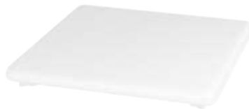
Ablaufdeckel KA 120 für CONOFLAT