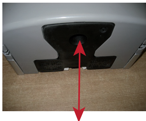
1) a 3)