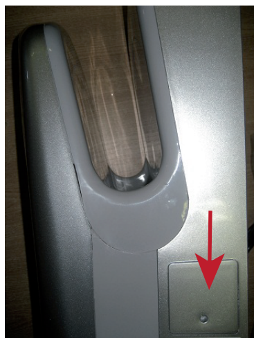
Kryt napájení na boku osoušeče